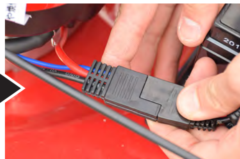
コネクタを接続したら完了です。