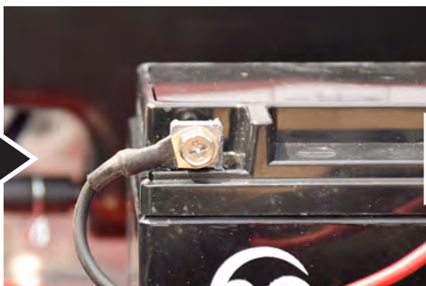
黒いコードを一に接続し、カバーを戻します。