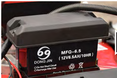
バッテリーのカバーを外します。