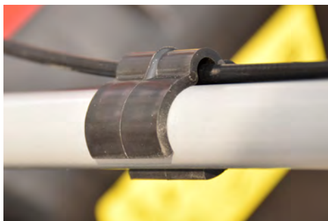
ワイヤークリップ