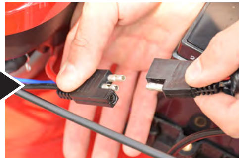
コネクタを一旦外すと、配線がしやすくなります。