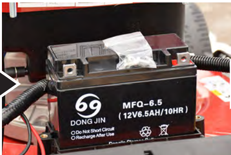
ボルト・ナットを取出します。